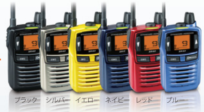
ブラック シルバー イエロー ネイビー レッド ブルー